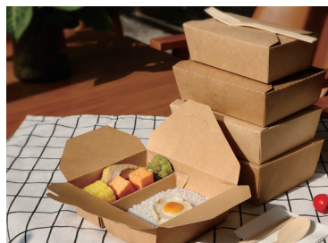
進口牛皮紙 安全保障