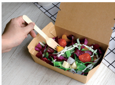
卡扣打包盒 可撕邊

Food-grade material, tearable edges, waterproof and oil-proof, glossy film/matte film optional.