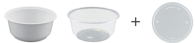
US-12/16/24/30A 白色 / 透明

Made of PP material, suitable for microwave ovens. Support size and brand personality customization.