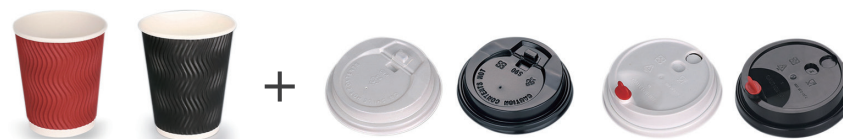
8/12/16 OZ 瓦楞杯 黑色/紅色